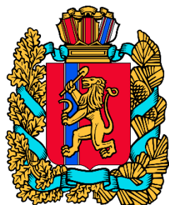
АДМИНИСТРАЦИЯ ГУБЕРНАТОРА КРАСНОЯРСКОГО КРАЯ