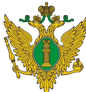
УПРАВЛЕНИЕ МИНЮСТА РОССИИ ПО КРАСНОЯРСКОМУ КРАЮ